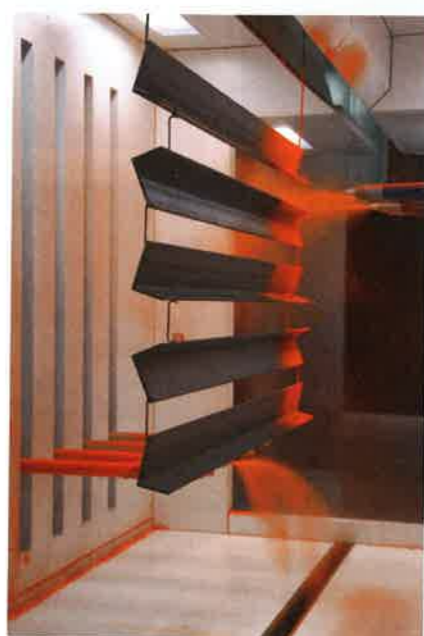
Die Automatikbeschichtung erfolgt mit zweimal vier Pistolen. Der Kabinenboden wird sequenziell abgeblasen.