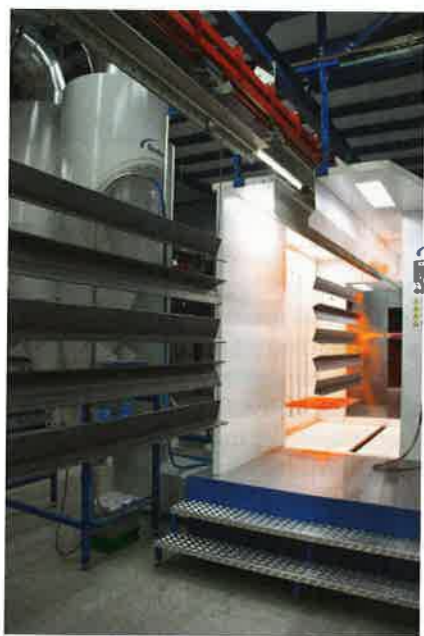
Die Automatikkabine basiert auf einem Standard-Schnellfarbwechselkonzept und wurde den knappen räumlichen Gegebenheiten angepasst.