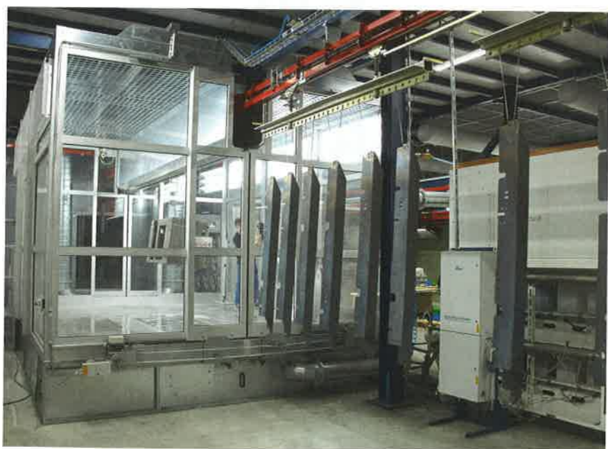
Die Handbeschichtung erfolgt auf Verlust in einer 5,5 x 4,1 Meter großen Glaskabine.